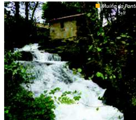
Muiño da Ponte

Muy agradable para hacer en familia y una escapada para los veraneantes de la zona en días nublados.