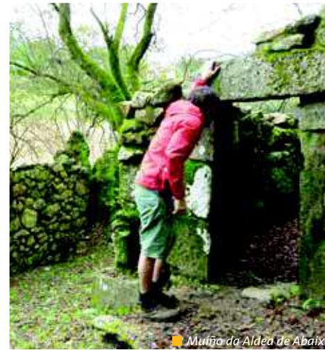
Muiño da Aldea de Abaixo

encontraremos mayor número de molinos, todos identificados por su nombre.