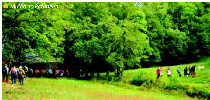
Muiño do Bataneiro

Un bonito recorrido por una zona de alto valor paisajístico y natural declarada Reserva de la Biosfera, Os Ancares Lucenses e Montes de Navia, Cervantes e Becerreá.