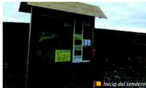
■ Inicio del sendero

Comienza en el Lugar do Couso, sigue por una zona montañosa de mata baja y nos conduce hacia el valle del río Donsal, pasando por la aldea de Quintá. Una vez en el valle, podemos desviarnos en la derivación para ver la oculta Fonte dos Corzos y la Fraga da Baliña hasta llegar a un bello rincón del río Donsal.